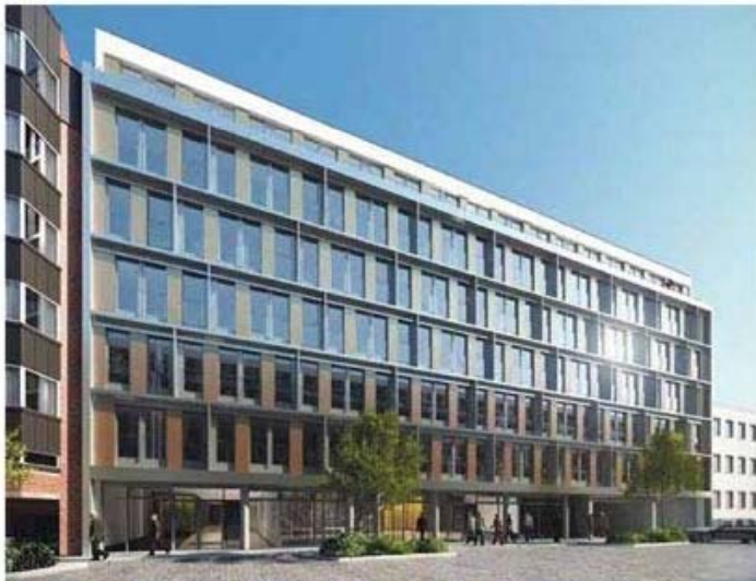
Das HanseAtrium, Wendenstraße 8 – 12 / Sachsenstraße 9 wird sich im März 2011 beeindruckend präsentieren

Das „HanseAtrium“ wird nach Fertigstellung mit leichter Verspätung voraussichtlich März 2011 (geplant war Ende 2010) Platz für insgesamt rund 15.000 Quadratmeter Mietfläche bieten, davon circa 650 Quadratmeter für Gastronomie und Läden. In einer gemeinsamen Tiefgarage