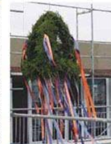
Das Hochziehen des Richtkranzes war der feierliche Höhepunkt des Richtfestes

Der Generalunternehmer, die Baufirma DITTING, wurde 1879 gegründet und hat ihren Stammsitz in Rendsburg, Niederlassungen in Hamburg, Schwerin und Berlin sowie Büros, unter anderem in Rostock. Derzeit gewährleistet 300 Mitarbeiter technische Know-how und kompetente Dienstleistungen rund um